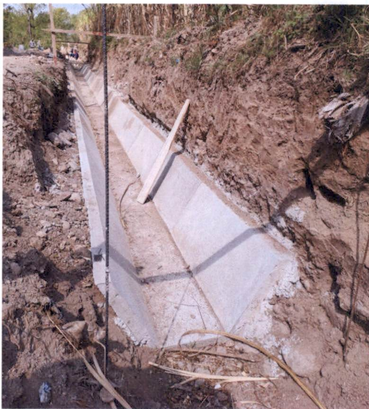
Fundición de canal primario: Se continua con la construcción del canal primario.