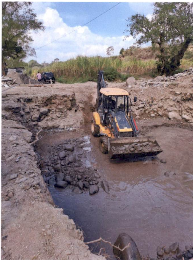
Construcción de Tanque Desarenador: Se está realizando la excavación para la construcción del tanque desarenador.