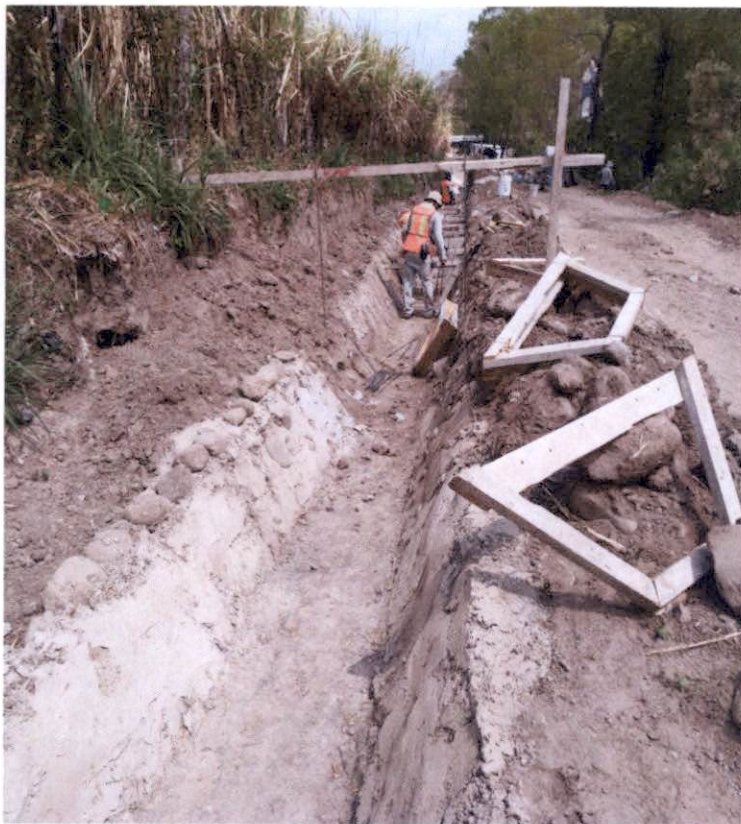
Fundición de canal primario: Se continua con la construcción del canal primario.

Brindan Casper José Caba Méndez INGENIERO CIVIL Colegiado No. 16,804