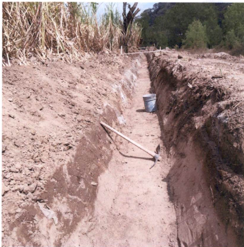
Fundición de canal primario: Se continua con la construcción del canal primario.

Brindes Caspar José Cuba, MSc INGENIERO CIVIL Colegiado No. 16,804